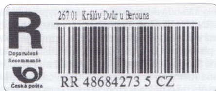
Typ CK 3 - logo České pošty malými písmeny, text názvu pošty i podacího čísla písmem Times (s patkami), podací číslo o délce 31 mm.

Na rozdíl od klasických RN, kde každá pošta měla svou řadu podacích čísel, jsou podací čísla u typu CK tištěna průběžně v jedné řadě pro všechny pošty až do čísla 99 999 999. Teprve po vypotřebování této deseti-milionové řady se číselná řada v tiskárně opakuje. Ke změně typu CK 1 na typ CK 2 došlo v tiskárně při tisku číselné řady počínající čísla 17 831 000 a 17 837 000.