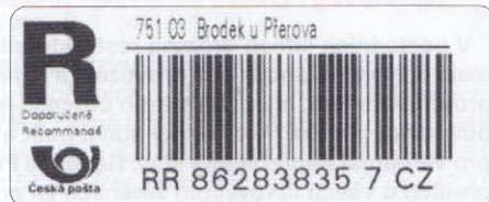
Typ CK 2b

Na uvedených RN se běžně vyskytuje postfix CZ. V určitých případech lze však nalézt i písmena jiná: