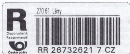
Typ CK 2 - logo České pošty malými písmeny, text i podací číslo jako u typu CK 1.