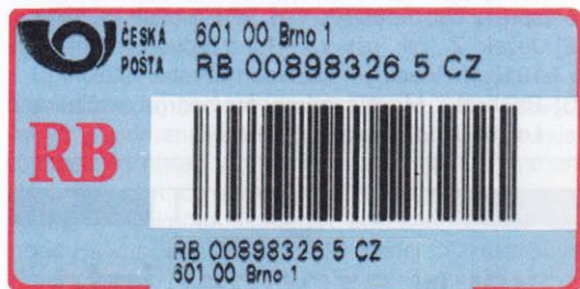
Typ RB 1

Tyto nové R-nálepky razantně změnilý svůj vzhled. Jsou větší, o rozměru 60 x 25 mm – samotný čárový kód má rozměr 40 x 13 mm. Celý tisk je proveden v černé barvě, bohužel včetně písmene R, které si dosud nikdo nedovedl představit jinak, než v barvě červené. Nad čárovým kódem je místo pro PSC a název pošty (30 znaků včetně mezer), pod čárovým kódem jsou pís-