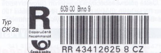
Typ CK 2a

Podtypy typu lze evidovat u typů CK 2 a CK 3, označujeme je CK 2a (CK 3a) a CK 2b (CK 3b). Pod písmenem R je dvouřádkové označení Doporučeně Recmandé, přičemž podtyp a má tyto řádky stejně dlouhé a podtyp b má slovo Doporučeně kratší. K této změně došlo v tiskárně při tisku číselné řady počínající čísla 75 736 000 a 75 815 000 někdy na konci roku 2010.