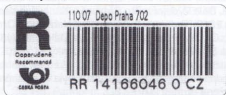
Typ CK 1 - logo České pošty velkými písmeny, text názvu pošty písmem Arial (zúženým) a podací číslo písmem Arial Narrow o délce 36 mm.

U RN s čárovým kódem rozeznáváme zatím tři základní typy (typologie byla schválena na valné hromadě Společnosti sběratelů poštovních nálepek dne 14. 4. 2012). V historické řadě kódů pro označování základních typů – R, CS, N, P, C, CR – byla tentokrát zvolena písmena CK, která mají vazbu na slova čárový kód.