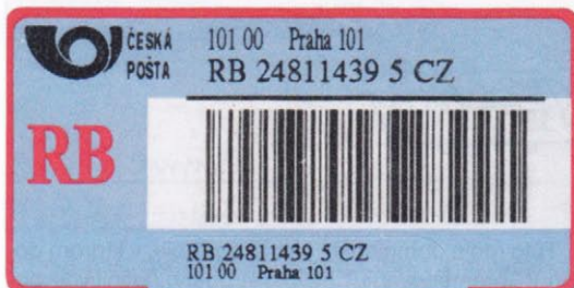
Typ RB 3

a RB 3. První dodávky tedy byly již brzy vypotřebovány a jsou méně dostupné.